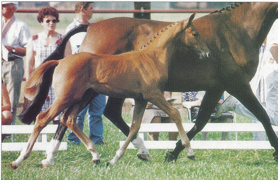
Noreen de Haar is een dochter van Jazz en Allure, de merrie met het flitsende achterbeen.