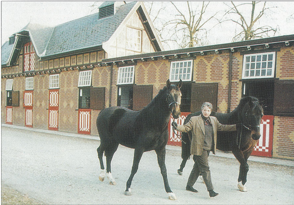
Met Gamine (v.Bentley) aan de linkerhand en haar Contango-dochter Mahalia de Haar aan de rechter op het stalplein.