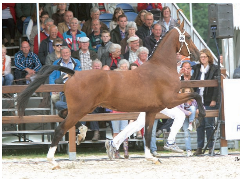
De door de fam. Postma gefokte Durose, nauw verwant aan Aurose, was dit jaar onze nationale kampioen bij de driejarige merries. Zij is in training met het oog op de IBOP.

Naarmate het aantal dekkingen groeide en Unieko steeds betere merries te bedienen kreeg, steeg het keuringssucces van de hengst met het afgelopen keuringseizoen als voorlopig hoogtepunt. Bij de tweejarige merries, waarbij in totaal drie Unieko-