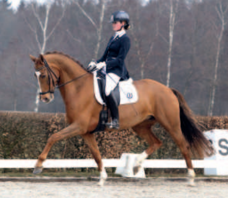
Elite-merrie Davina DVB (Johnson x Ulft) behaalde tijdens haar IBOP-proef een absolute topscore van 90 punten.