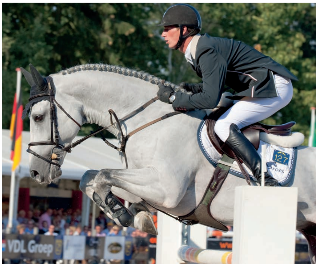
Bij het KWPN werd zoon Untouchable (mv.Heartbreaker) goedgekeurd. Onder Daniel Deusser springt de geëxporteerde hengst in de grote sport.