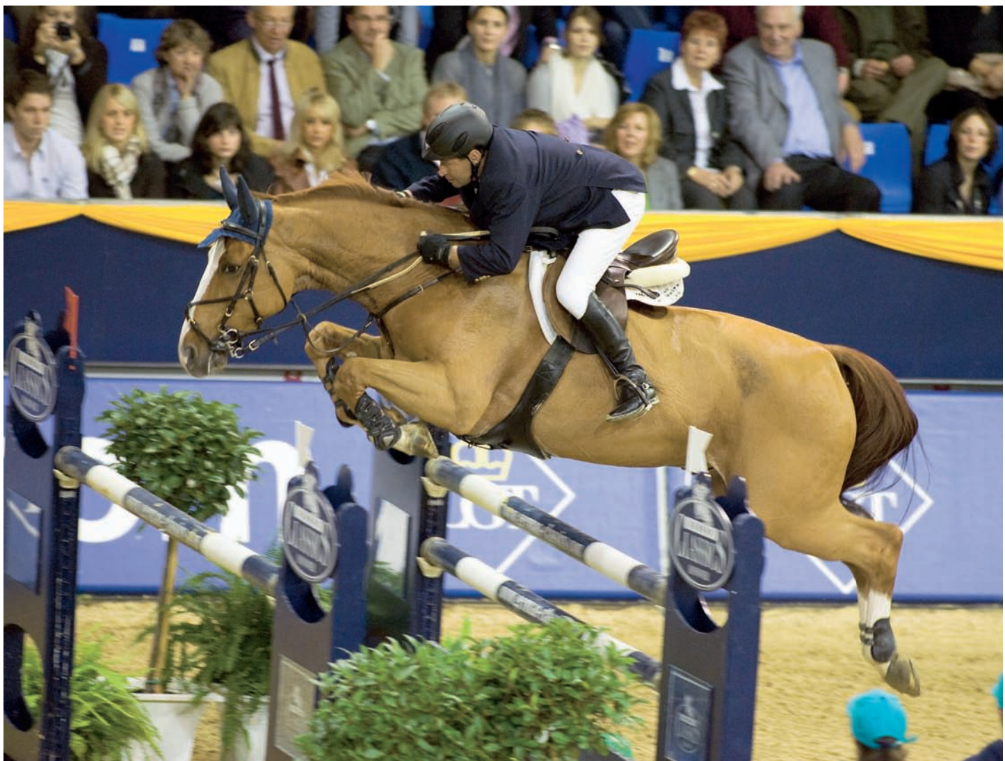
In februari dit jaar is de sterk verervende Hors la Loi II postuum keur verklaard door het KWPN. Hij sprong zelf jarenlang op internationaal niveau en heeft zich zeer goed vererft.

De Frans gefokte Hors La Loi II heeft een bewogen carrière achter de rug. Onder diverse topruiters heeft de voshengst zijn grote kunnen getoond in de internationale sport, maar zijn karakter en hengst-zijn speelden hem menigmaal parten. Waar Hors La Loi II vooral nooit enige twijfel over heeft laten bestaan, zijn de kwaliteiten van hem als fokhengst. Uit een relatief klein aantal dekkingen valt een heel stel nakomelingen positief op, zoals op het hoogste niveau Untouchable, Vocas en Verdi III. Daarnaast is hij vader van toekomsttalenten als Woodstock O, Harley 86, Makavoy en Voloma. Het KWPN verklaarde Hors la Loi II in februari dit jaar postuum keur.