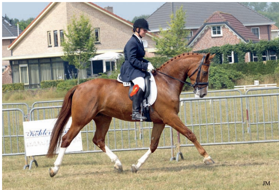
Try Me (stamboeknaam Tinus mv.Zichem) won drie keer de rubriek Bestgaand Rijpaard in Hengelo, startte in de Z1-dressuur en werd vervolgens als leerpaard verkocht naar België.