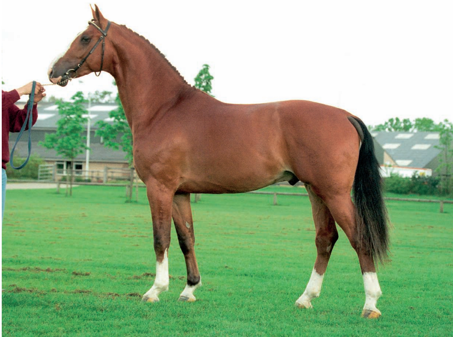
Koss, hier als jong paard, heeft een grote invloed uitgeoefend op de Gelderse fokkerij, hij bracht twee goedgekeurde zonen en kleinzonen en vele keuringtoppers.

Koss is een begrip in de 'Gelderse wereld'. Zeventien jaar is hij inmiddels en zelden heeft een paard zo'n grote invloed uitgeoefend op een populatie als deze keurhengst. Onder zijn kinderen en kleinkinderen bevinden zich de nodige keuringskampioenen. Niet verwonderlijk, want Koss komt zelf uit een bijzonder goed nest, waarin al generaties lang streng werd geselecteerd op kwaliteit. Inmiddels heeft Koss twee goedgekeurde zonen en kleinzonen, maar verkeert zelf ook nog in uitstekende conditie.