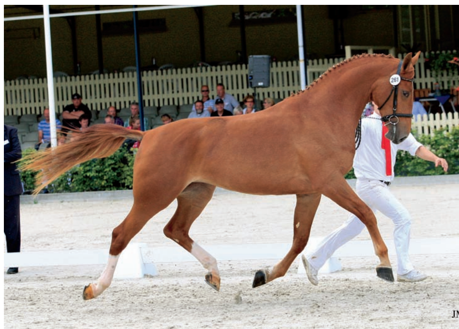
Bodessa (mv.Ahoy) werd dit jaar op de Nationale Merriekeuring reservekampioen bij de driejarige Gelderse merries. Haar volle zus Adessa was als driejarige het beste dressuurpaard in Canada.