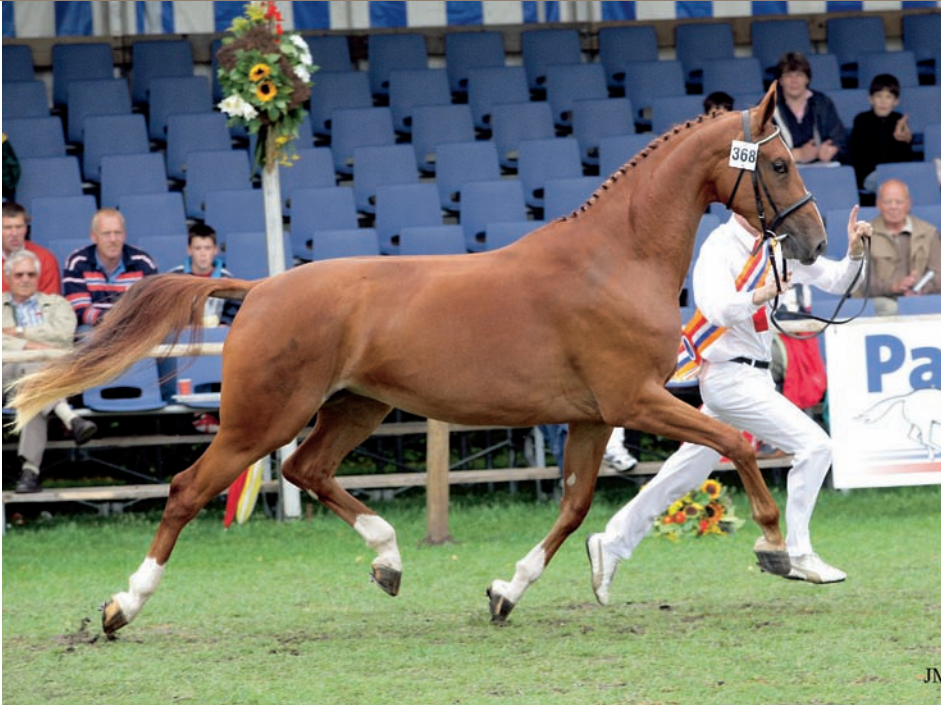
Wilma (ster PROK mv.Cabochon) voert de lijst van Gelderse merries met een dressuurfokwaarde hoger dan 120 aan.