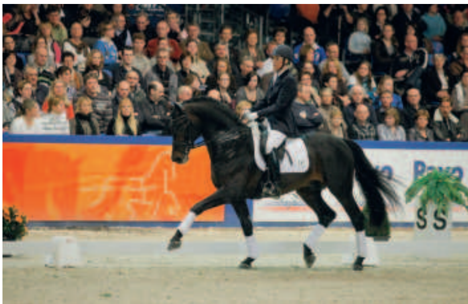
De Lichte Tour-dressuurhengst Lord Leatherdale valt op in de fokkerij. Zijn oudste producten gooien steevast hoge ogen in de jongepaardencompetities.

Lord Leatherdale nam als driejarige deel aan het voorjaarsonderzoek en ontpopte zich als een werkwillige en zeer getalenteerde hengst. In de verrichtingsrapportage wordt hij omschreven als een hengst met veel bereidheid tot werken, die zich goed laat bewerken. De stap is zuiver en ruim voldoende van ruimte. De draf is goed van ruimte en voldoende gedragen.