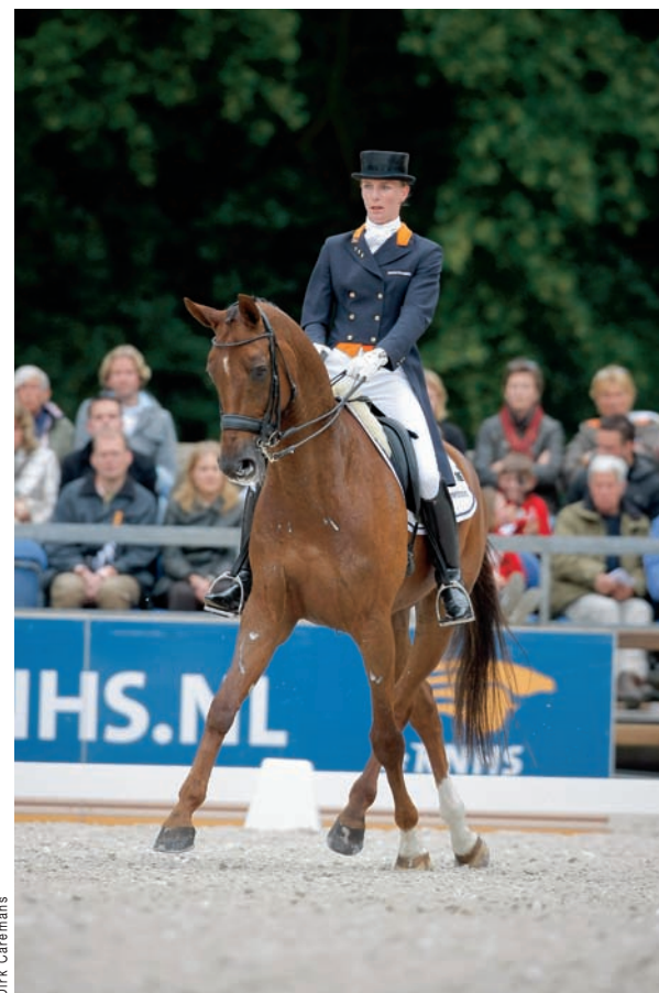
Imke Schellekens-Bartels reed naast Lancet ook diverse nazaten, zoals deze Rhapsody die als jong paard tweemaal deelnam aan de finale van de Pavo Cup en later in de Lichte Tour is uitgebracht.