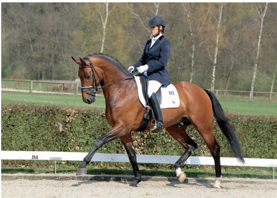
Als jong paard nam de kwaliteitsvolle KWPN-goedgekeurde Ziësto twee maal deel aan het WK in Verden. De Lancet-zoon zal nu opgeleid worden voor het hogere werk.